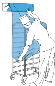
Наденьте покрытие на тележку, потянув вниз